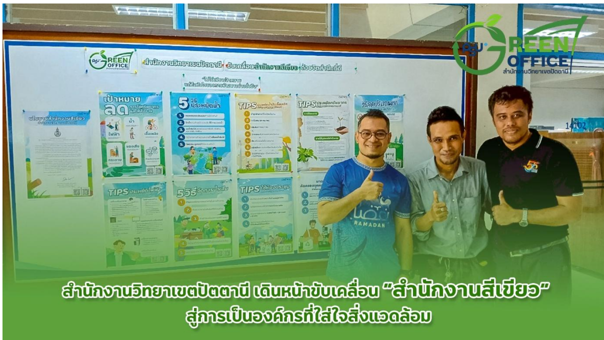
สำนักงานวิทยาเขตปัตตานี เดินหน้าขับเคลื่อน "สำนักงานสีเขียว" สู่การเป็นองค์กรที่ใส่ใจสิ่งแวดล้อม